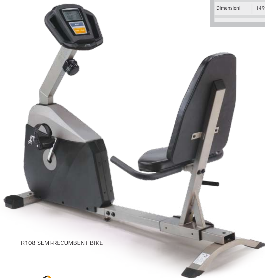
R108 SEMI-RECUMBENT BIKE